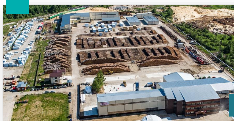
Строительство завода по переработке древесины, компания «Хольц Хаус» в г. Луза, Кировской области (заём + инфраструктура)