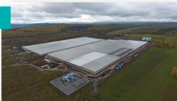
Строительство инфраструктуры для агрокомплекса «Горный» в г. Усть-Катав, Челябинской области