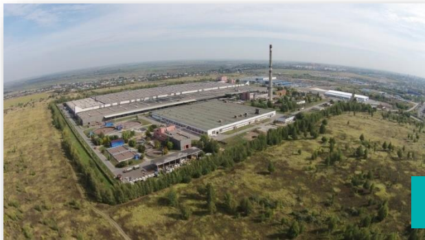
Запуск кожевенного завода «Русская кожа Алтай» в г. Заринск, Алтайский край